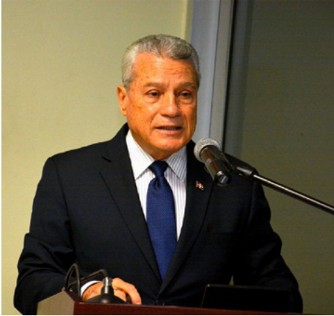
Nelson Toca Simó. Ministro del MICM

El Ministro de Industria, Comercio y Mipymes (MICM), Nelson Toca Simó, realizó los siguientes anuncios en el discurso central de la Semana Mipyme 2017 :